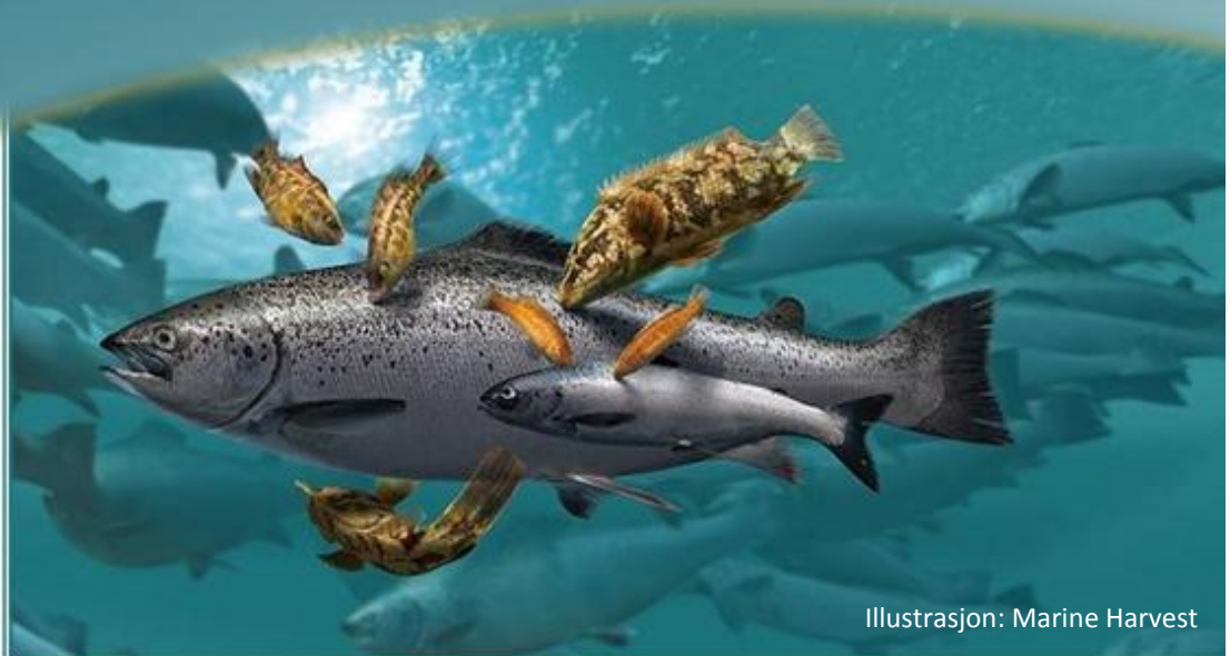
Illustrasjon: Marine Harvest